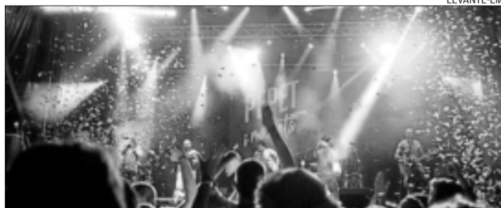
Cientos de jóvenes disfrutaban de los conciertos del Feslloch.