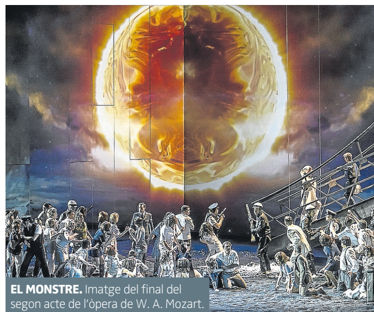
EL MONSTRE. Imatge del final del segon acte de l'òpera de W. A. Mozart.

El ballet sobretot, en el final de l'obra va amenitzar amb un esperit especialment dinàmic (tal vegada en excés i escàs vincle amb la